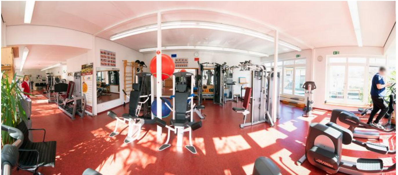
Panoramaaufnahme vom Gerätepark - die Trainingsfläche beträgt ca. 140 qm